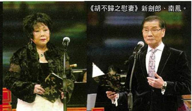
《胡不歸之慰妻》新劍郎、南鳳。