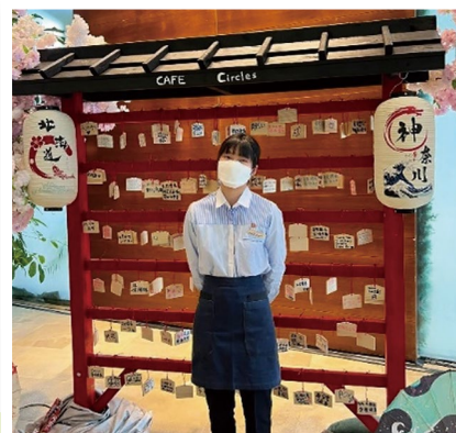
旅遊及款待業高級文憑高級文憑學生在荃灣西如心酒店實習