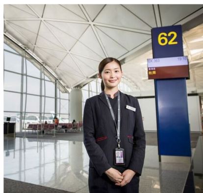
旅遊及航空業高級文憑學生在香港國際機場實習