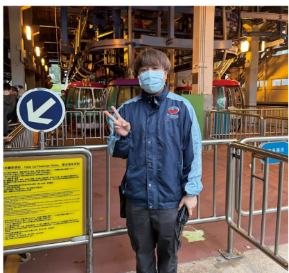
度假區及主題樂園管理高級文憑學生在香港海洋公園實習