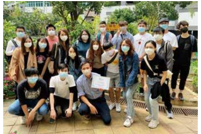
同学们参观香港善导会