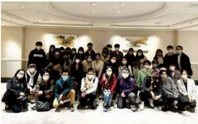
同学到香港朗廷酒店参观酒店实务