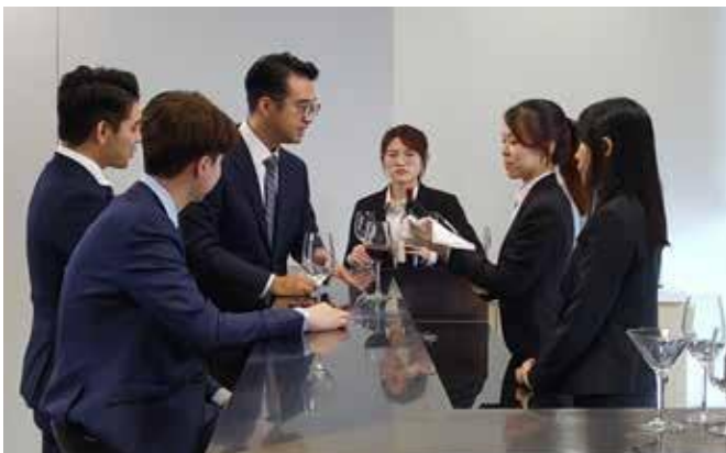
教授同学餐酒知识