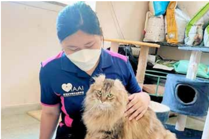
同学们到动物收容所实习。