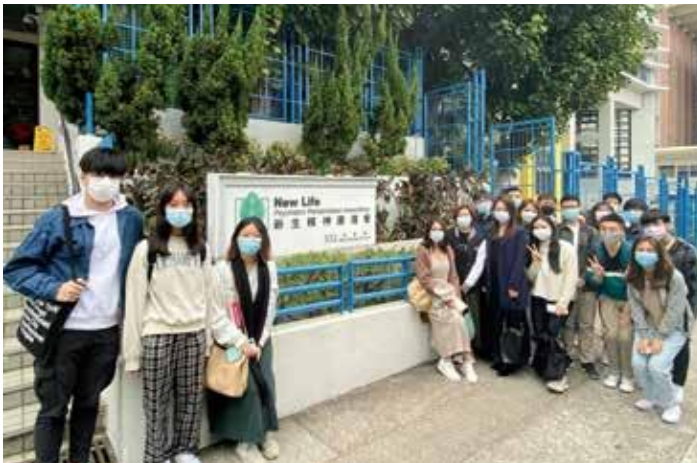
同学们参观新生精神康复会