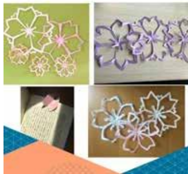
学院举办书道、折纸等文化交流活动