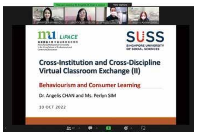
与新加坡新加坡新加坡大学商学院进行网上交流