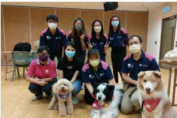
学生们为机构提供动物辅助活动服务。