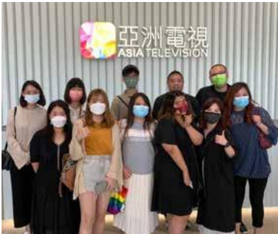
参观亚洲电视数码媒体