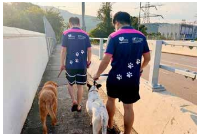
学生们照顾流浪犬。