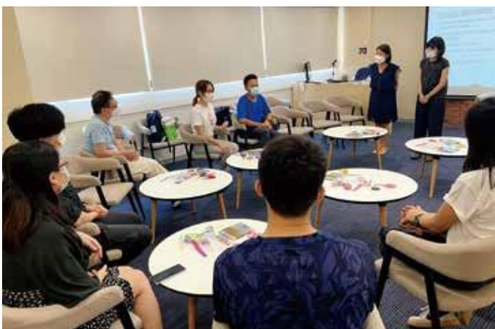
校外心理学家举办的工作坊