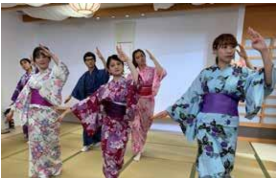
在学期间，同学可获资助到日本游学及实习（东京、福冈、高知、宫崎、宫城等），体验及了解日本文化。