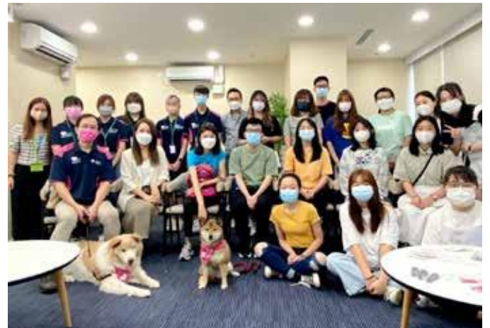
开学前的迎新活动。