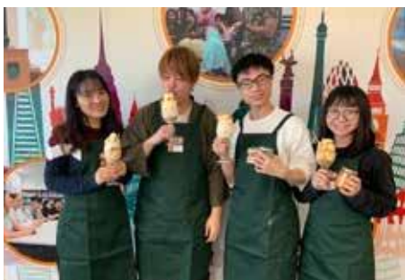
日本文化交流活动