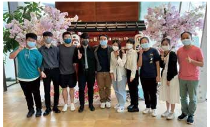
同学在香港如心酒店成功完成实习