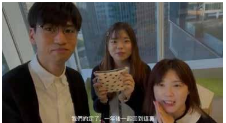
我們約定了，一年後一起回到這裏