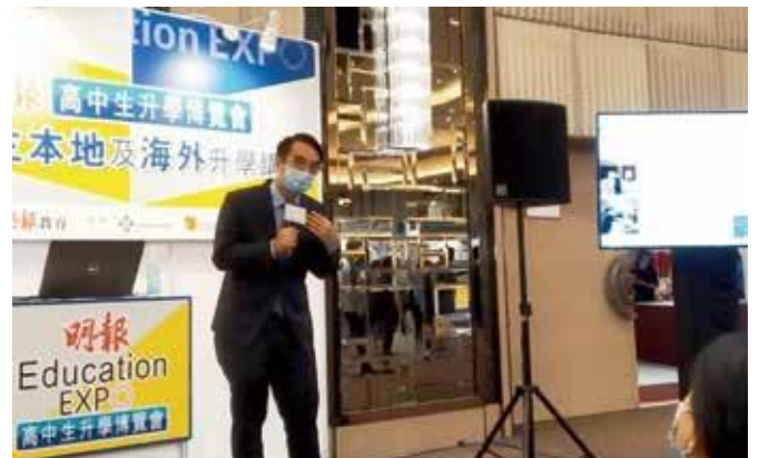
应邀出席高中生本地及海外升学讲座